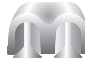
Einlassventil mit High Spirit 100